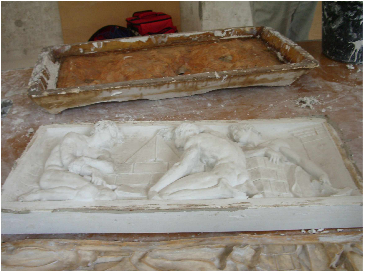
E4 Fenster 7 links, Grundlagen des Bauens , Senklot, Abguss und Silikonform