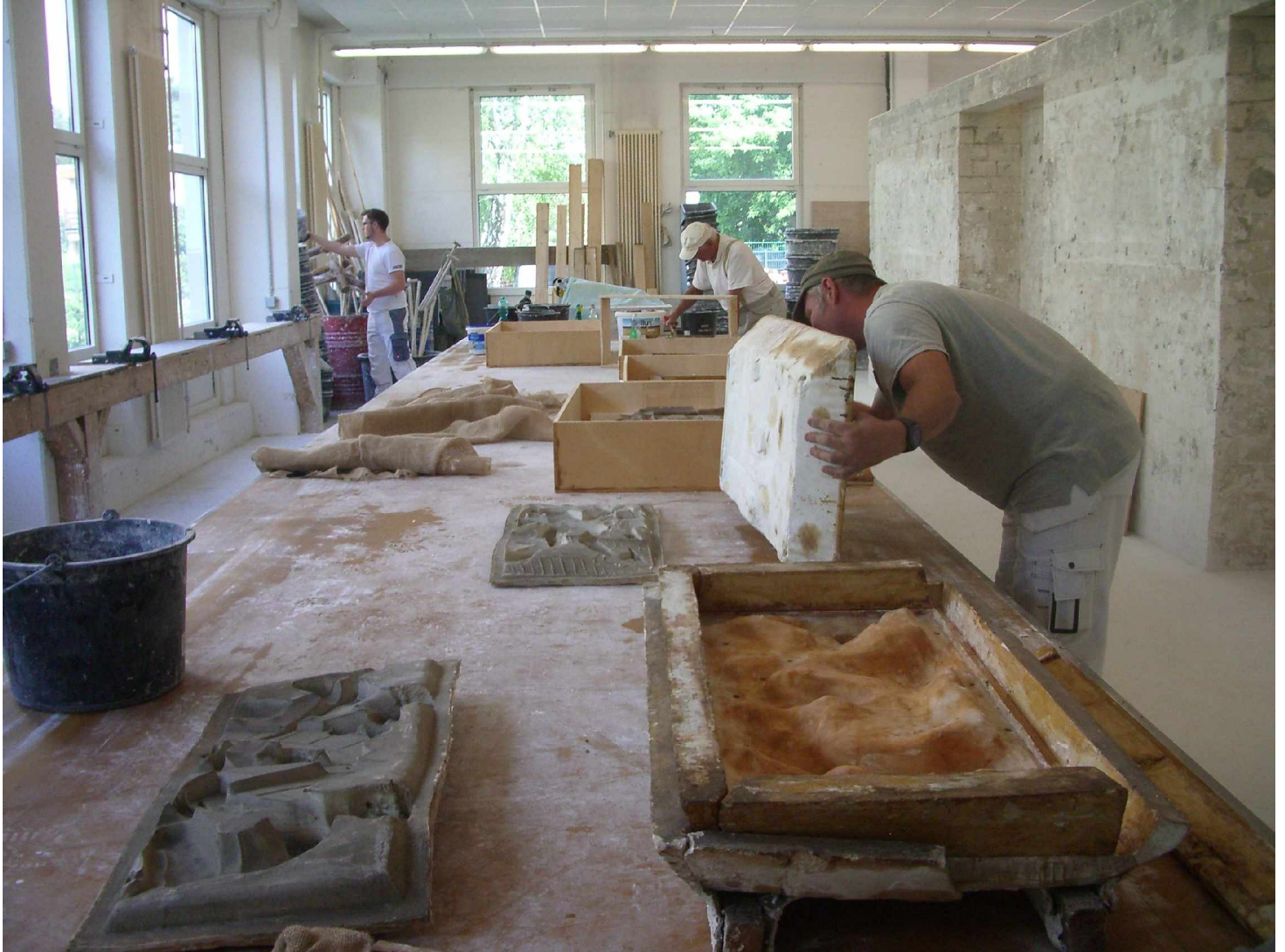
A1 Stuckwerkstatt des Lehrbauhofs der Fachgemeinschaft Bau Berlin und Brandenburg e.V., Silikonformen von Reliefplatten der alten Fassade der Bauakademie (Förderverein Bauakademie)