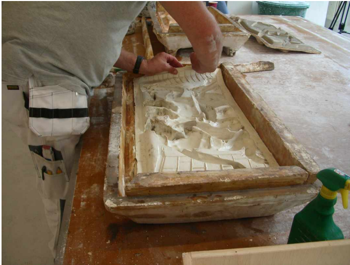
A3 Fenster 4 links, bearbeitete Silikonform Malerei