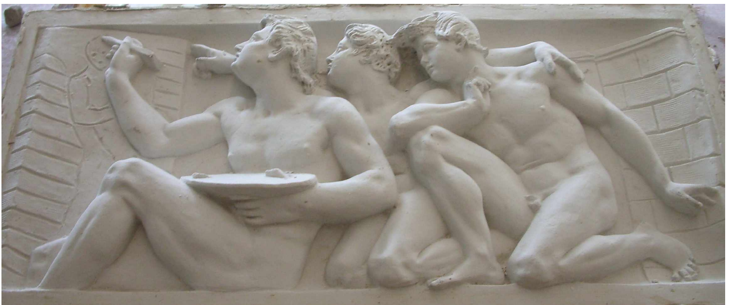
A5 Fenster 4 links, Malerei , Gipsabguss