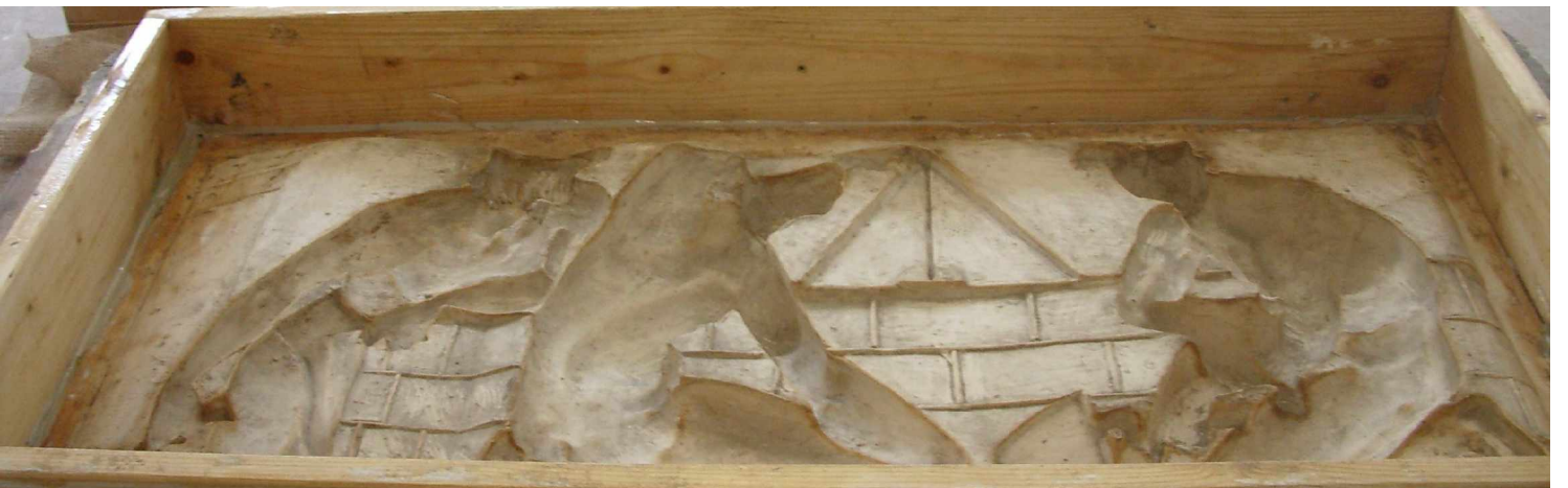
E1 Fenster 7 links, Grundlagen des Bauens , Senklot, Silikonform