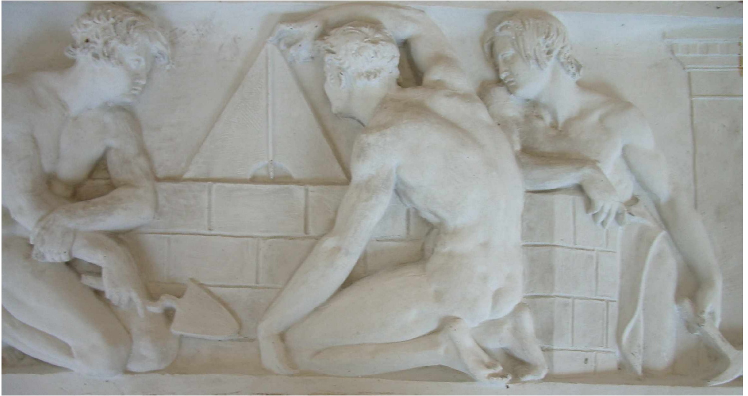
E4 Fenster 7 links, Grundlagen des Bauens, Senklot Abguss, Ausschnitt

Es handelt sich um 6 Silikonformen von Reliefplatten aus den Fassaden der Schinkelschen Bauakademie aus den 50er Jahren des 20. Jahrhunderts. Sie befinden sich im Eigentum des Fördervereins Bauakademie und sind z.Z. an die Fachgemeinschaft Bau Berlin und Brandenburg e.V. verliehen.