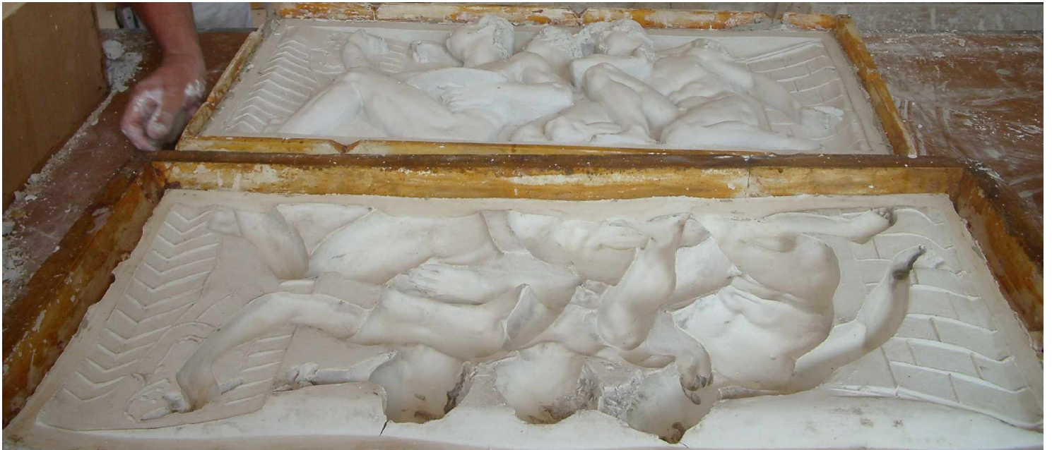
A4 Fenster 4 links, Malerei , Abguss mit Silikonform