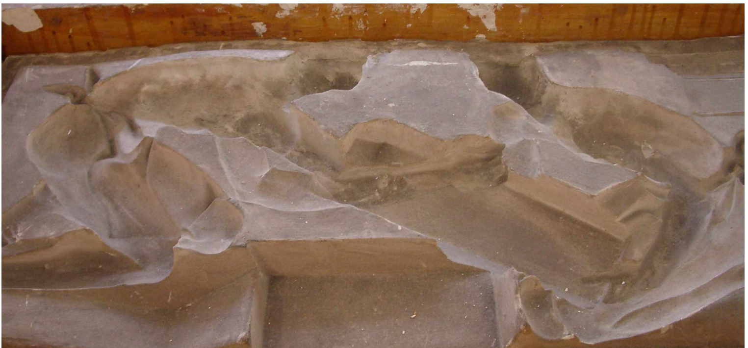
G Fenster 3 links, Grundsteinlegung , Silikonform