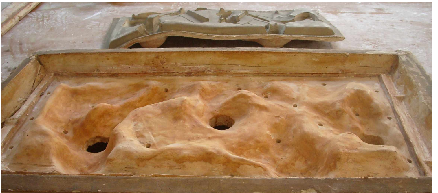
C3 Fenster 6 rechts Bogenbau , bearbeitete Silikonform