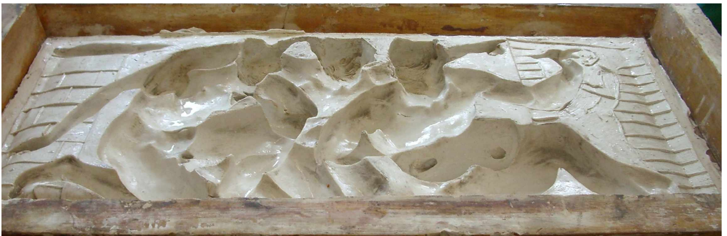
A2 Fenster 4 links Malerei , Silikonform