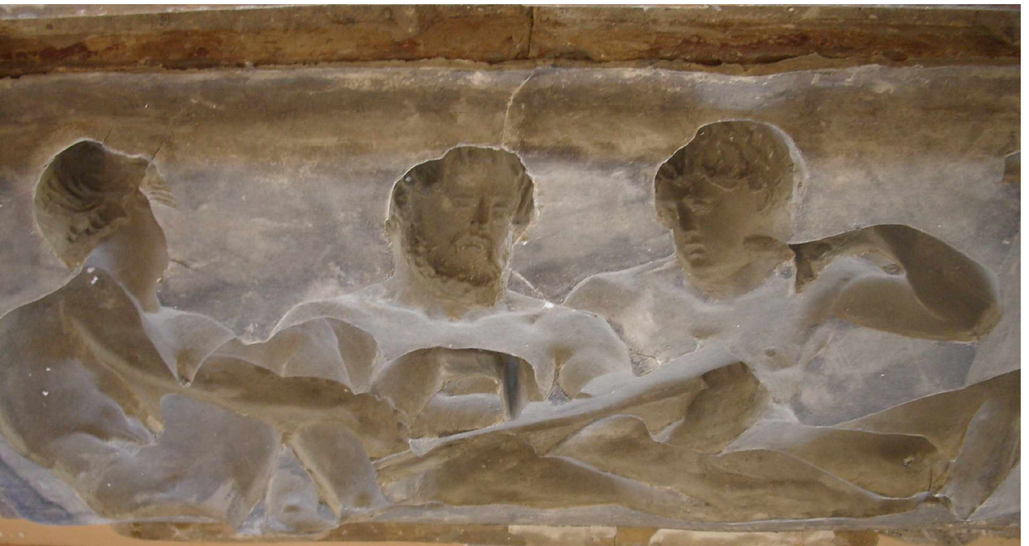
H Fenster 7 rechts, Kreisbogen , Silikonform