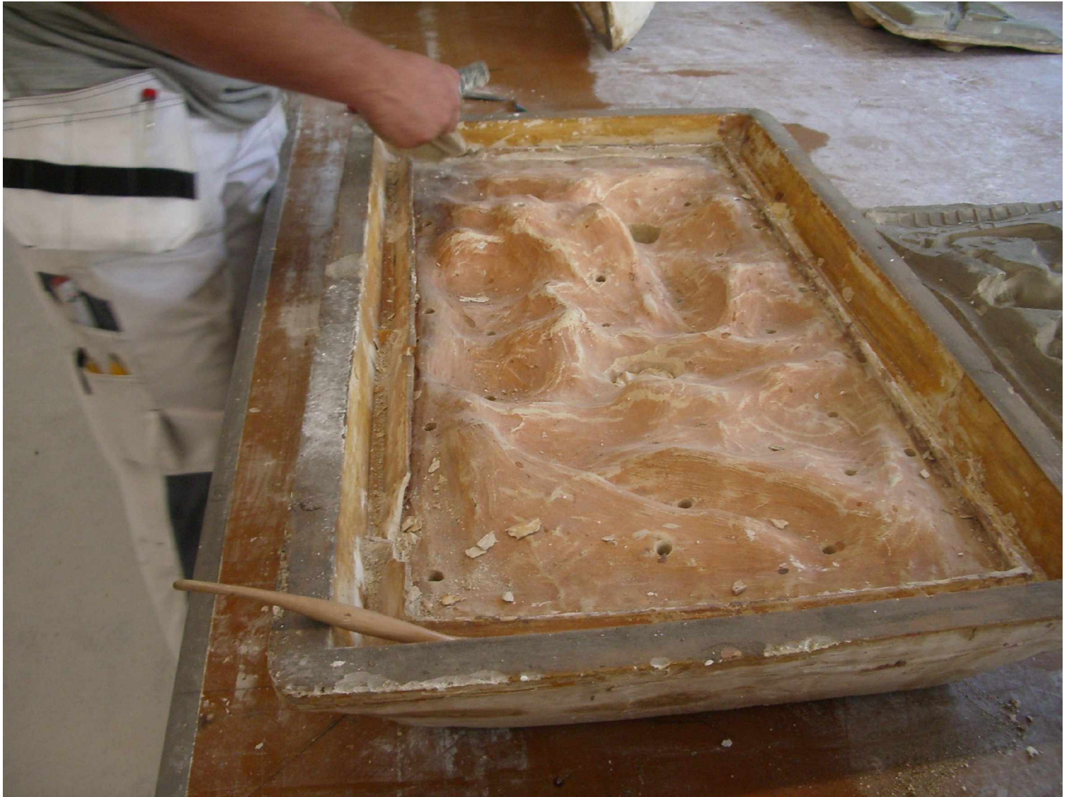
C2 Fenster 6 rechts Bogenbau , bearbeitete Silikonform