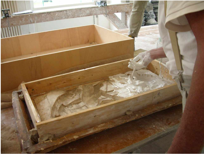
E2 Fenster 7 links, Grundlagen des Bauens , Senklot, Silikonform, Beginn der Füllung