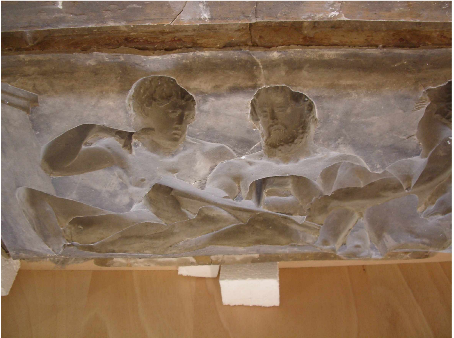
B Fenster 8 links, Ende des Arbeitstages , Silikonform - Hier bietet sich ein Test nicht an, da für die Musterfassade (Nord-Ost-Ecke der Bauakademie) bereits eine Nachbildung erstellt wurde. Die Form kann für weitere Reliefplatten verwendet werden. -