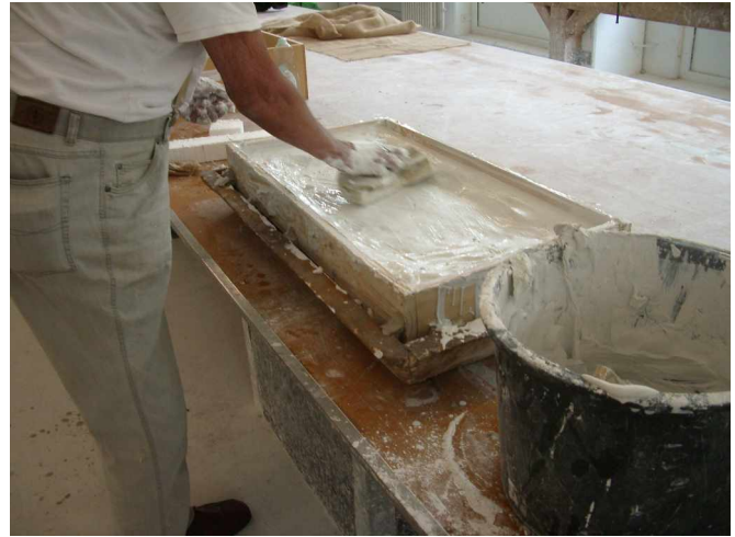
E3 Fenster 7 links, Grundlagen des Bauens , Senklot, gefüllte Silikonform